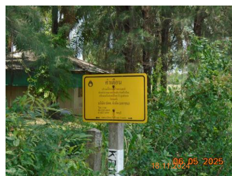
ภาพที่ 2-2 ป้ายแสดงตำแหน่งแนวท่อส่งก๊าซธรรมชาติ