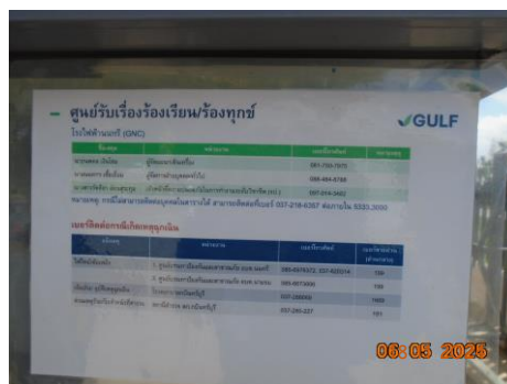
ภาพที่ 2-1 ศูนย์รับเรื่องร้องเรียน