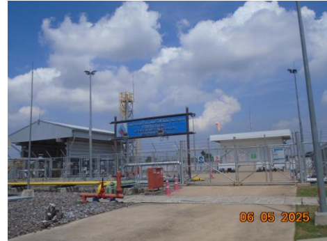
ภาพที่ 2-4 เจ้าหน้าที่รักษาความปลอดภัย บริเวณสถานีควบคุมความดันและวัดปริมาณก๊าซธรรมชาติ (MRS)