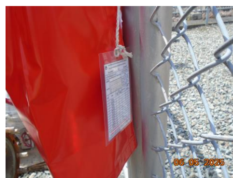
ภาพที่ 2-3 ถังดับเพลิงแบบเคมีผง และ Tag ตรวจสอบถังดับเพลิงแบบเคมีผง