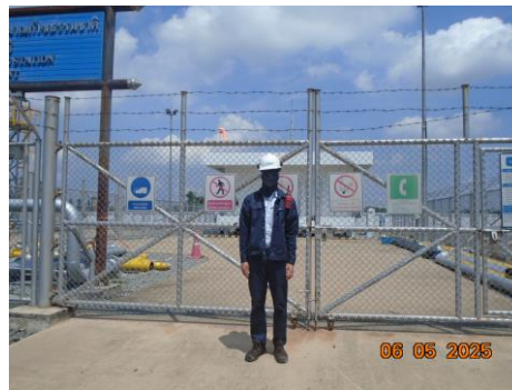
ภาพที่ 2-5 พนักงานสวมใส่อุปกรณ์คุ้มครองอันตรายส่วนบุคคล